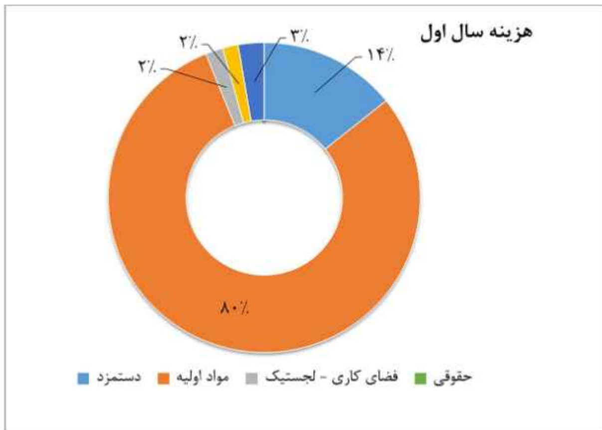
شکل ۵-۱ تصویر نمودار مصارف سرمایه

در جداول ذیل به بررسی دقیق‌تر درآمدها و هزینه‌کردهای شرکت خواهیم پرداخت.