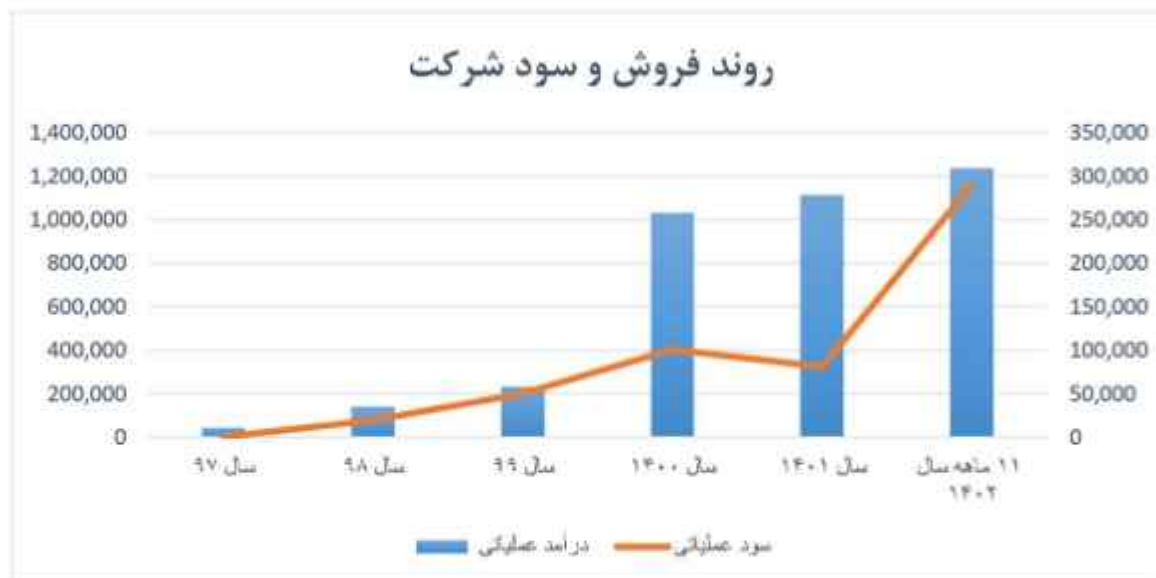
شکل ۱-۱ روند فروش و سود شرکت نساجی وایل ریس

همان‌طور که در جدول مشخص است تعداد مشتریان در طول دوره فعالیت شرکت افزایشی بوده است که می‌توان به یکی از نقاط قوت شرکت اشاره کرد.