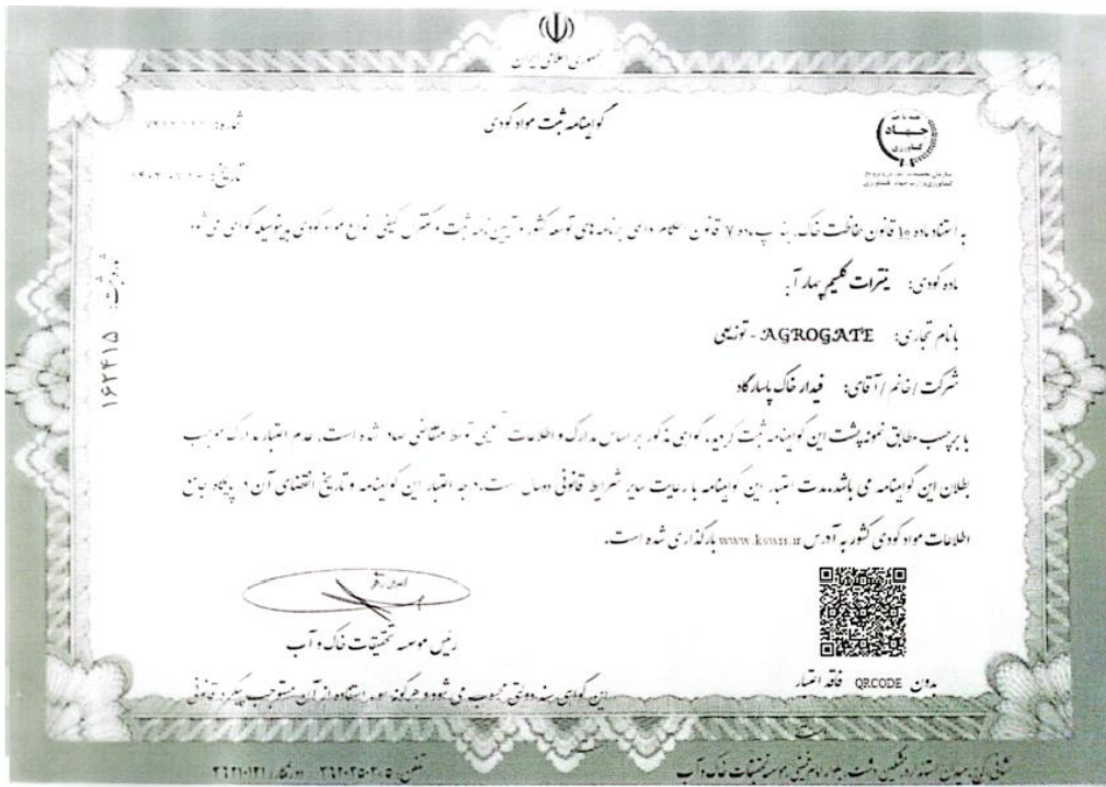
شکل ۱-۴ تصویر گواهی‌نامه جهاد کشاورزی مواد کودی نیترات کلسیم چهار آبه