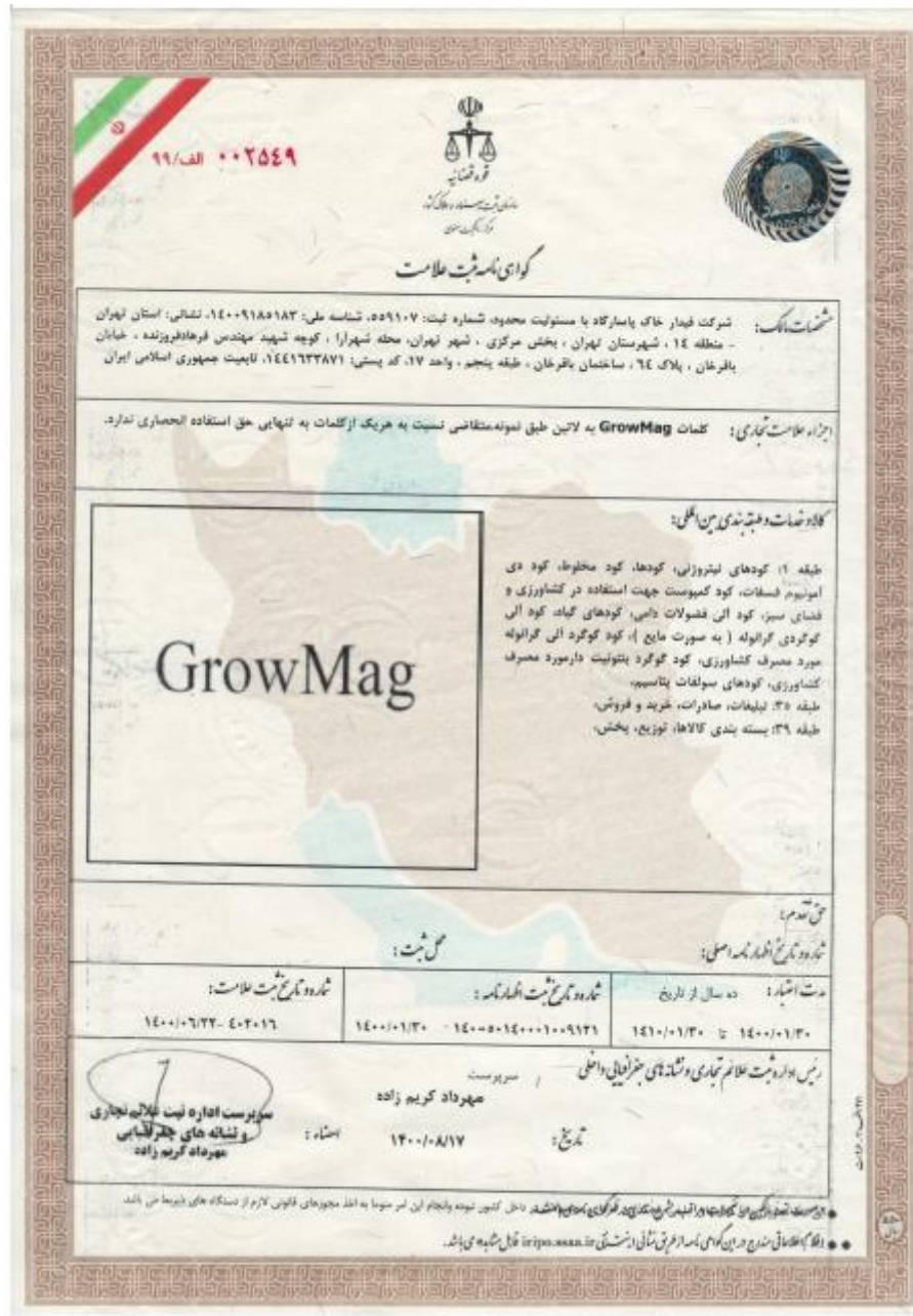
شکل ۱-۶ گواهی نامه ثبت علامت GrowMag