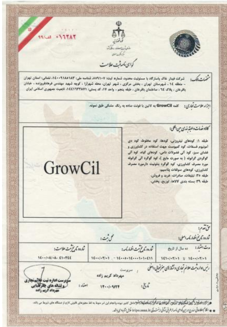
شکل ۱-۷ گواهی نامه ثبت علامت GrowCil