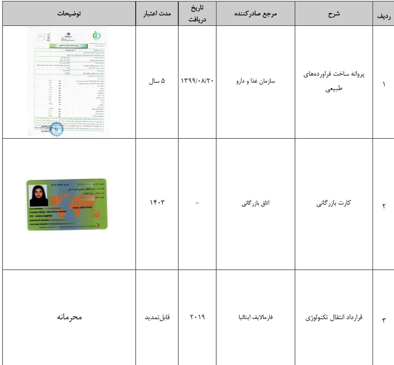
جدول ۱-۵ لیست گواهینامه‌ها، تقدیرنامه‌ها و مجوزهای شرکت

لیست برخی از گواهینامه‌ها، استانداردها و مجوزهای شرکت هستی دارو درمان به شرح جدول زیر است.