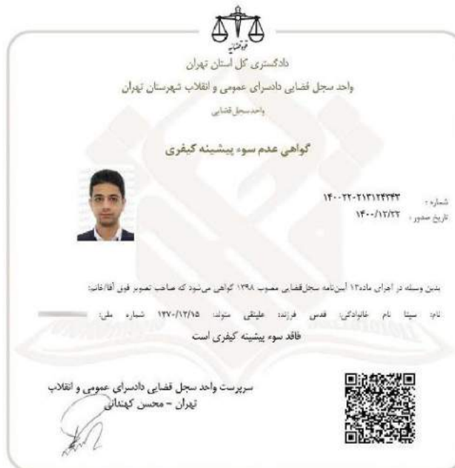
شکل ۱-۳ تصویر گواهی عدم سوء پیشینه مدیرعامل