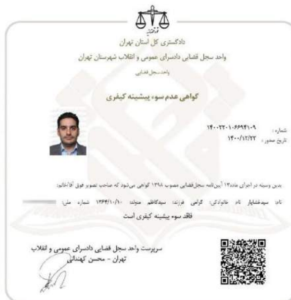
شکل ۱-۱ تصویر گواهی عدم سوء پیشینه رئیس هیات مدیره