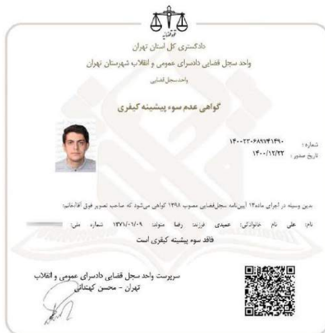
شکل ۴-۱- تصویر گواهی عدم سوء پیشینه نماینده شرکت کارن عضو اصلی هیئت مدیره