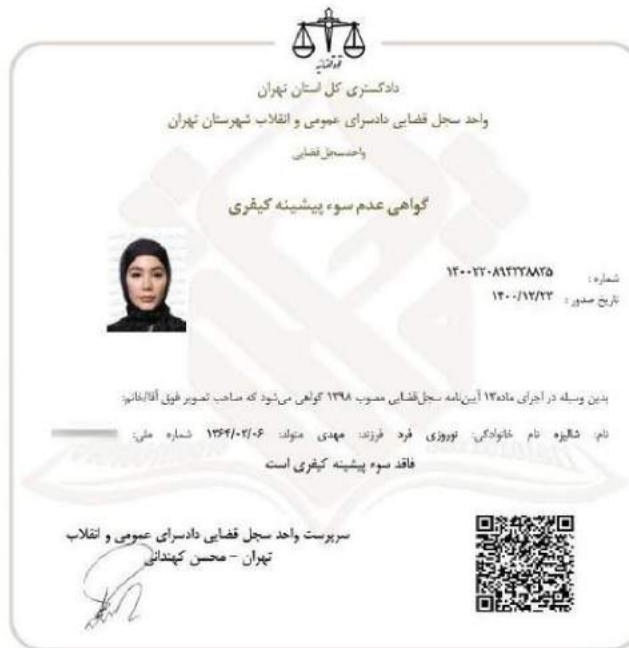
شکل ۱-۳ تصویر گواهی عدم سوء پیشینه نائب رئیس هیئت مدیره

نام سکوی تامین مالی جمعی: گروه پیشگامان کارآفرینی کارن