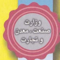
تصویر پروانه بهره برداری

*این پروانه با توجه به توضیحات پشت صفحه دارای اعتبار است.