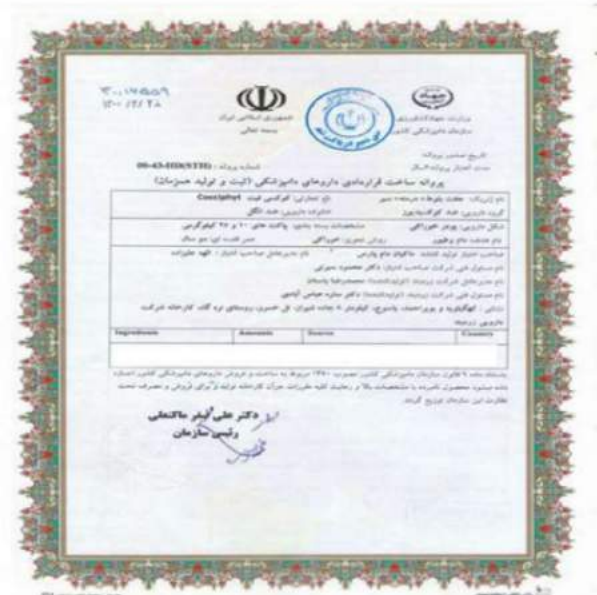
شکل ۱-۲- تصویر پروانه ساخت قراردادی داروهای دامپزشکی