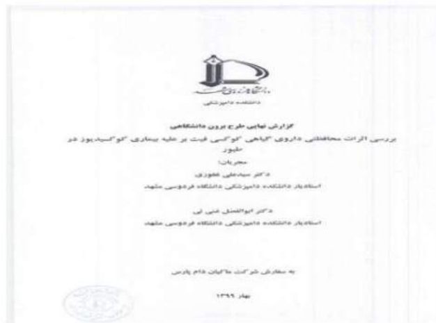
شکل ۱-۳- تصویر گزارش آزمایش فارمی محصول در دانشگاه فردوسی مشهد