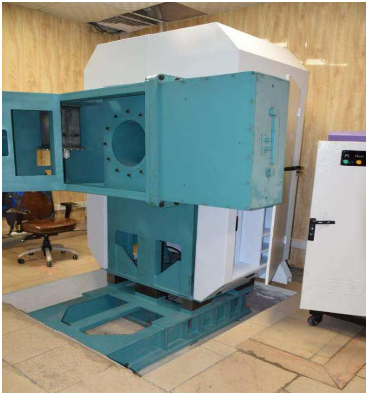
تصویر بخش‌هایی از دستگاه شتابدهنده خطی پزشکی