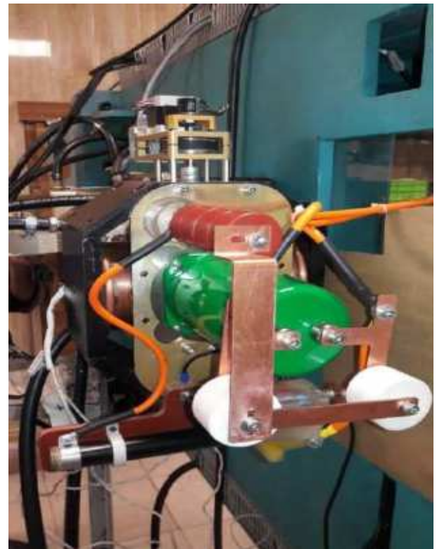
تصویر بخش‌هایی از دستگاه شتابدهنده خطی پزشکی