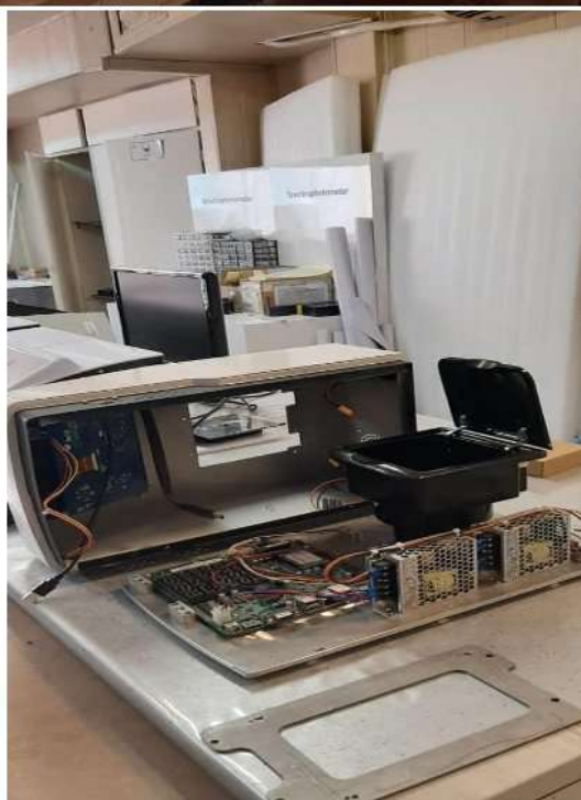
تصاویری از دستگاه‌های ساخته شده شرکت بلور آزماي سنجش نور