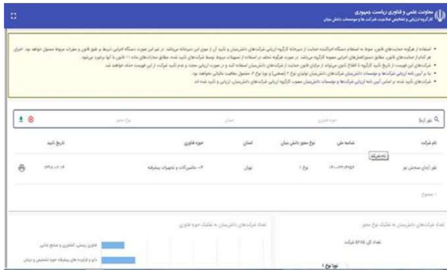
شکل ۱-۲- تصویر گواهی دانش‌بنیانی شرکت