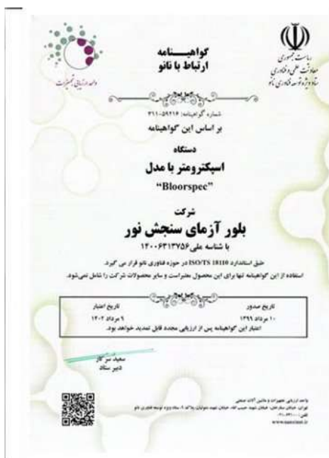
شکل ۱-۱- گواهینامه ارتباط با ستاد نانو