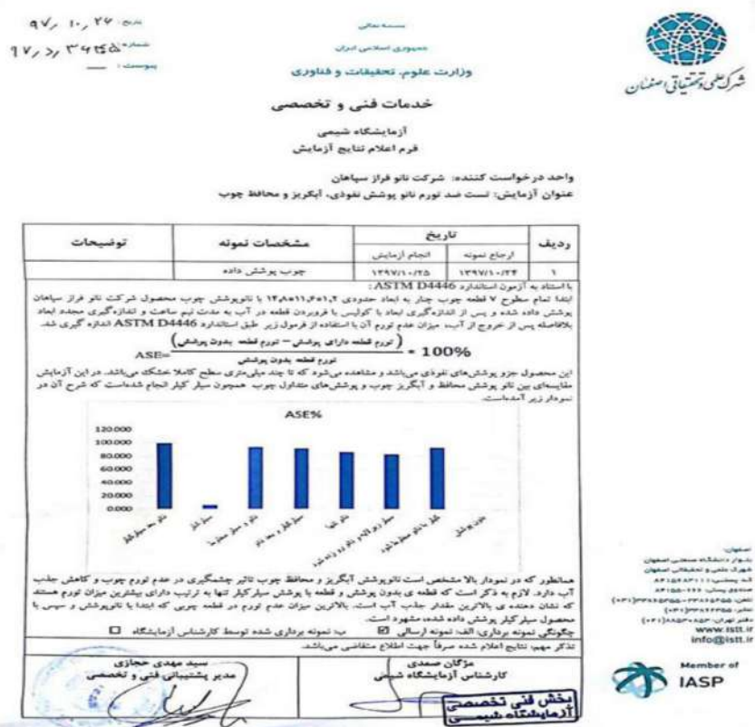
شکل ۱-۱ تصویر استاندارد ASTM D4446 شرکت نانو فراز سپاهان