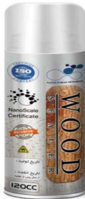
تصویر محصول اسپری نانو پوشش چوب

گزارش پایان دوره‌ای تولید و فروش نانو پوشش چوب