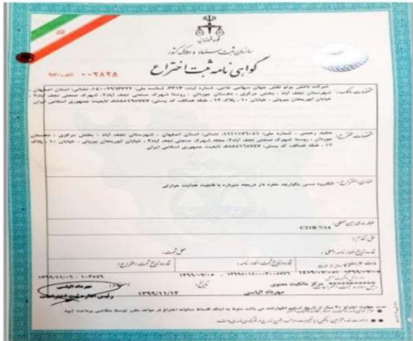
شکل ۱-۲- گواهی نامه ثبت اختراع الکتروود مسی شرکت دانش پرتو نقش جهان