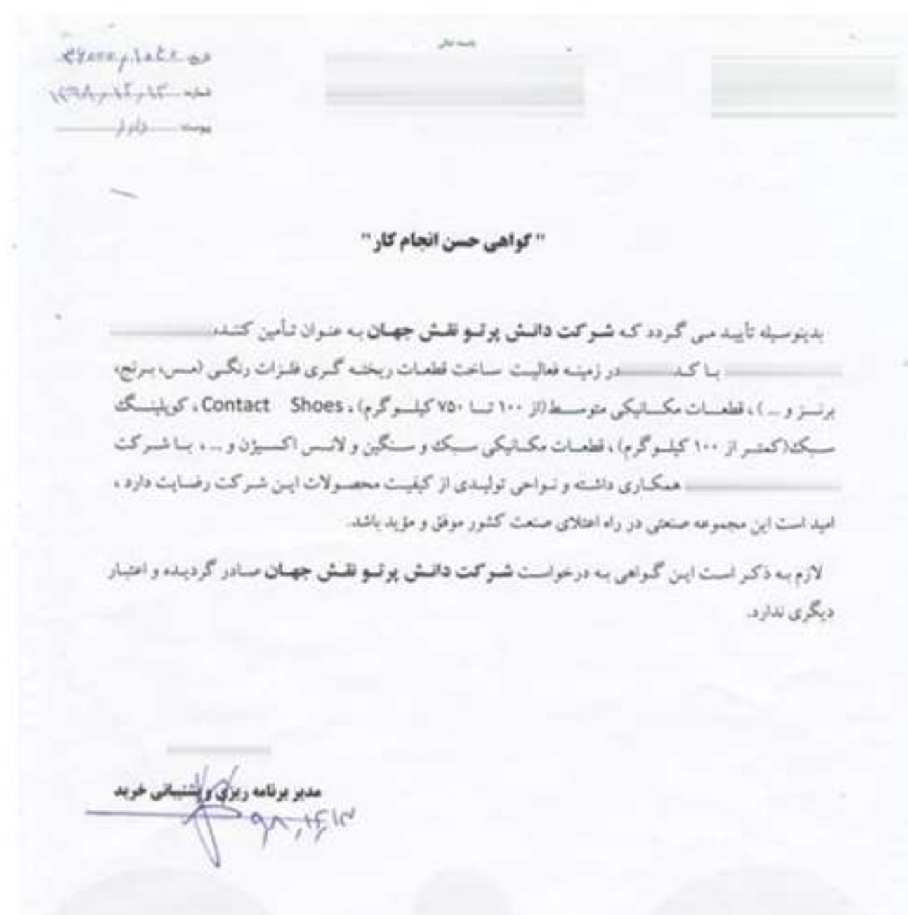
شکل ۶۱ گواهی حسن انجام کار از شرکت