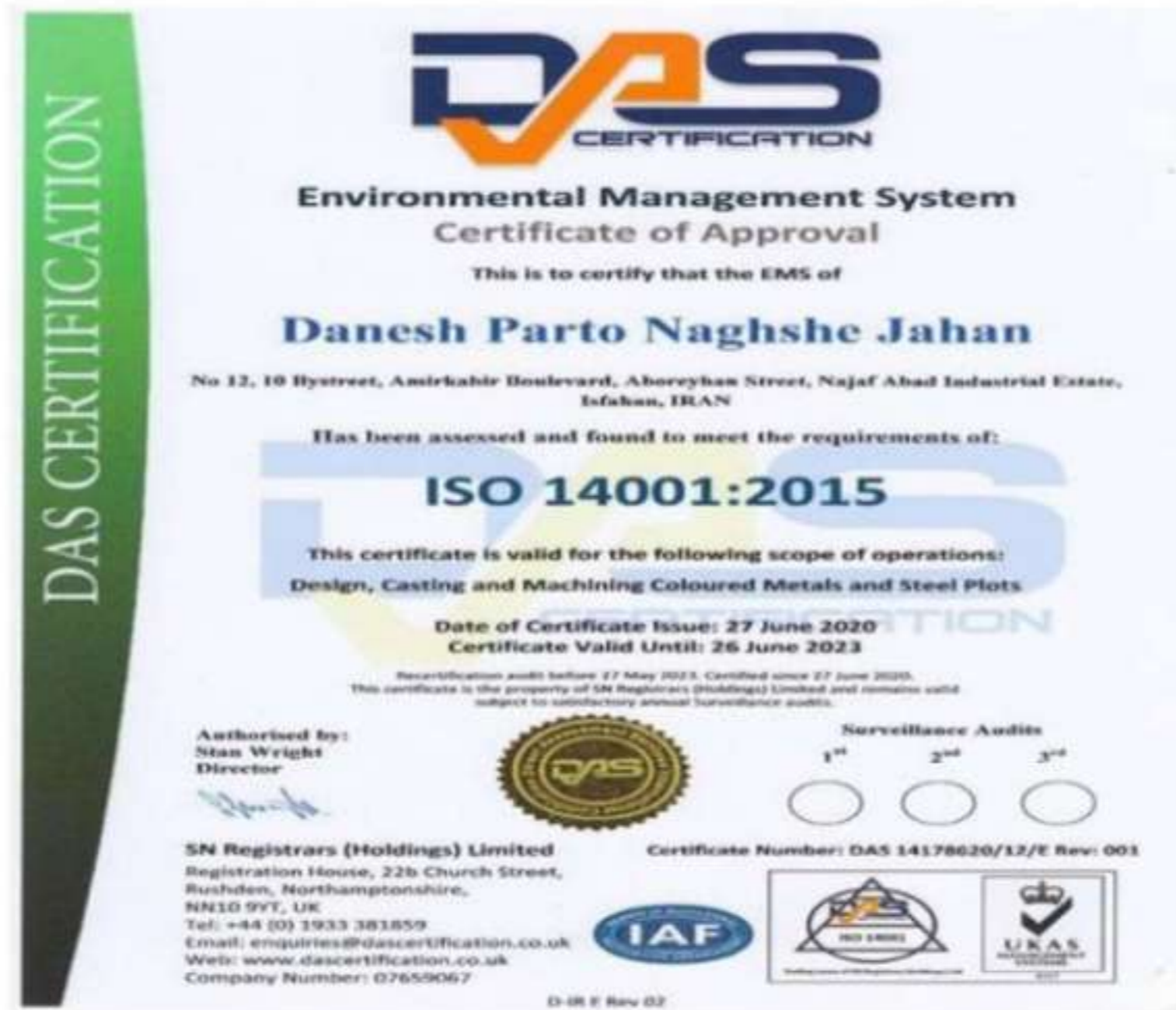
شکل ۱-۴- تصویر مجوز ایزو ۱۴۰۰۱