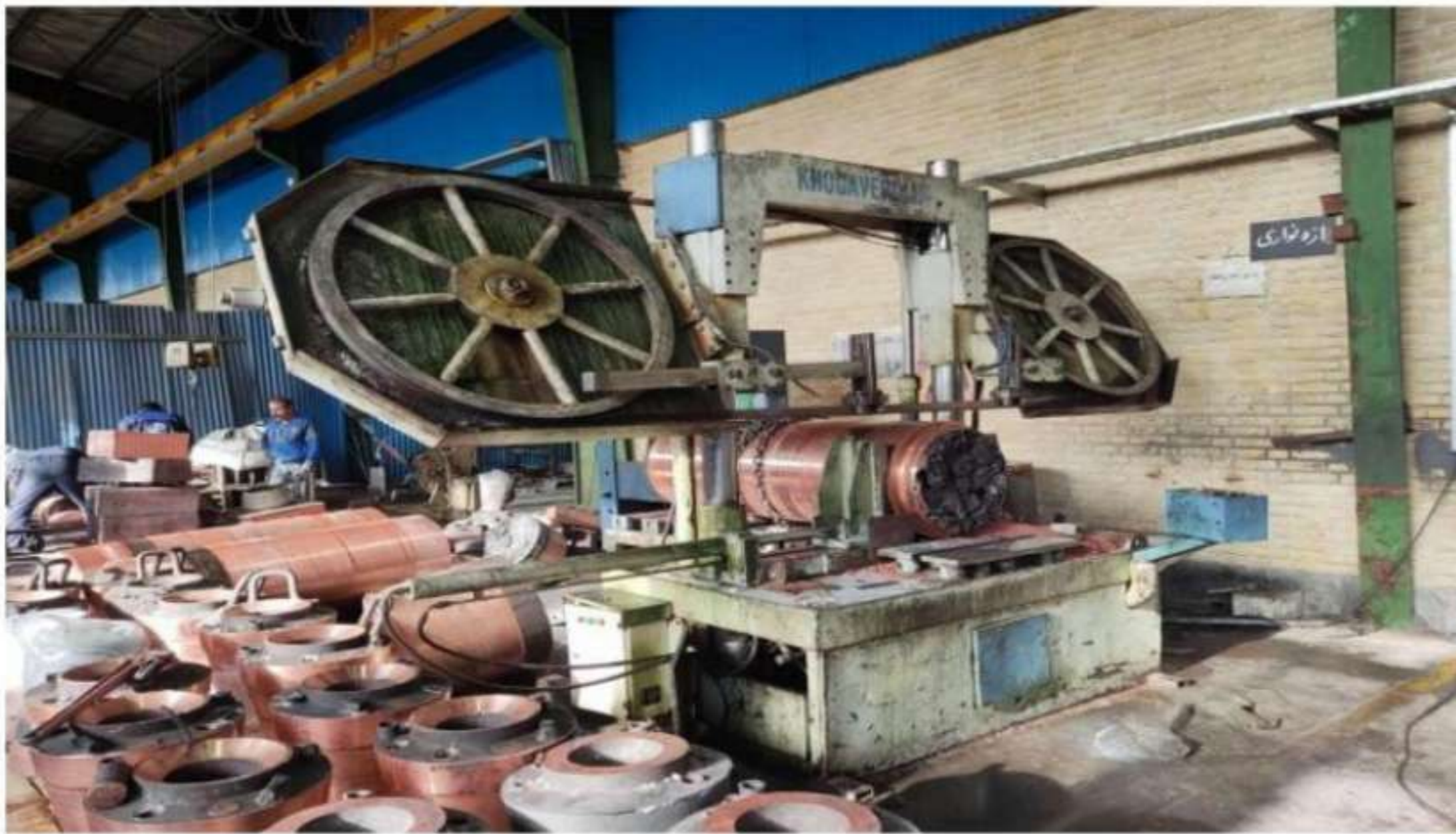
تصویر ساخت محصول در مرحله برشکاری با ااره