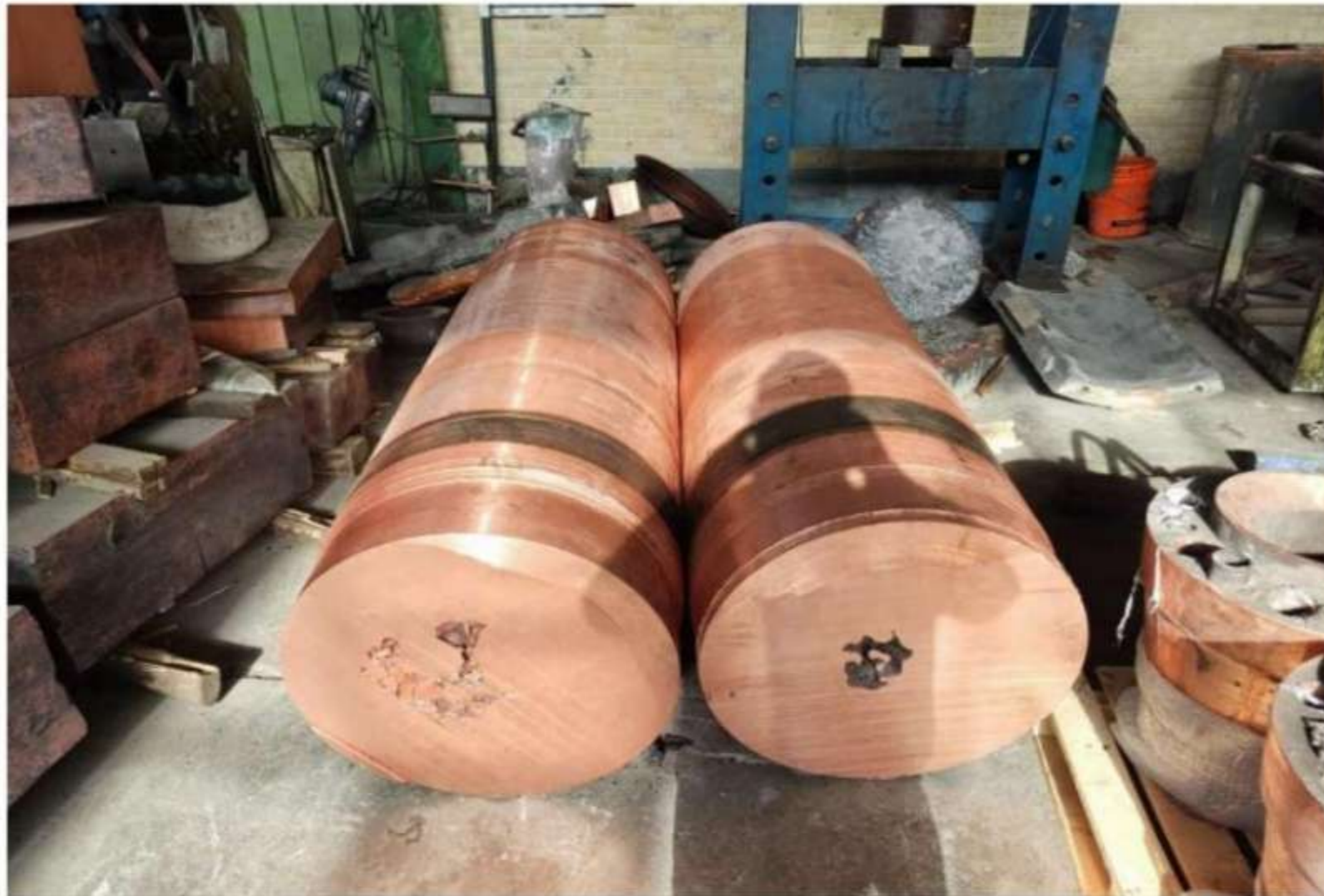
تصویر ساخت محصول بعد از ریخته‌گری و گرده‌تراشی