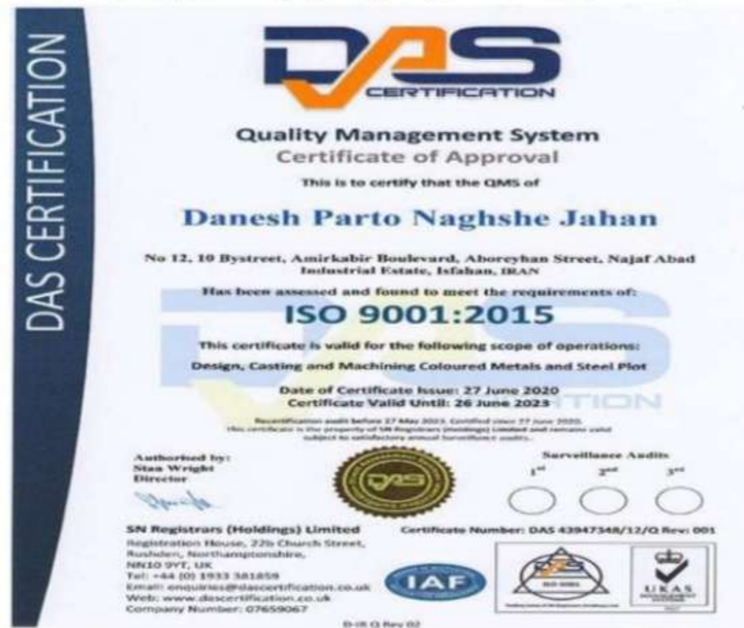
شکل ۱-۳- تصویر مجوز ایزو ۹۰۰۱