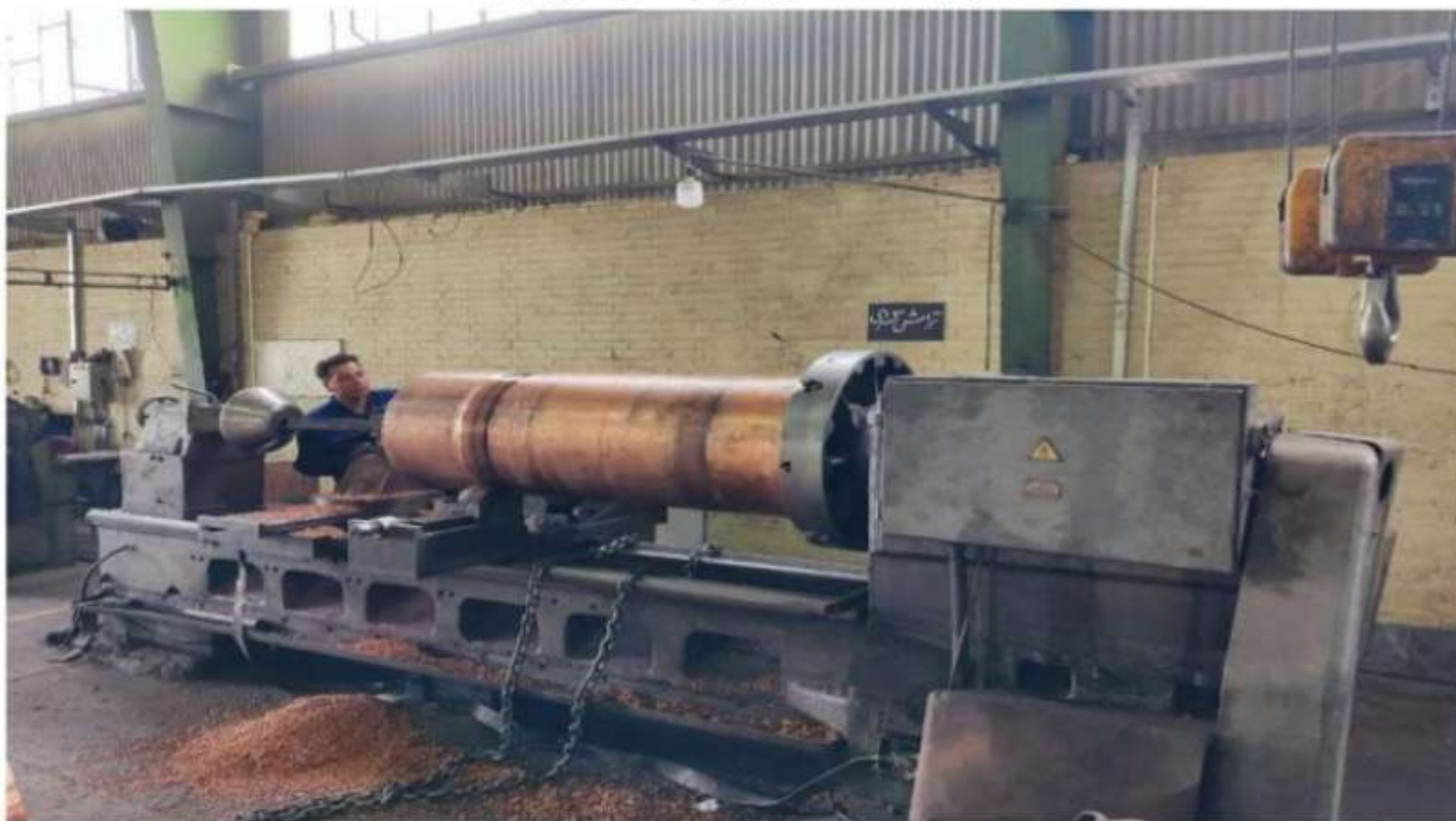
تصویر ساخت محصول در مرحله تعبیه سیستم آبگرد الکتروود مسی