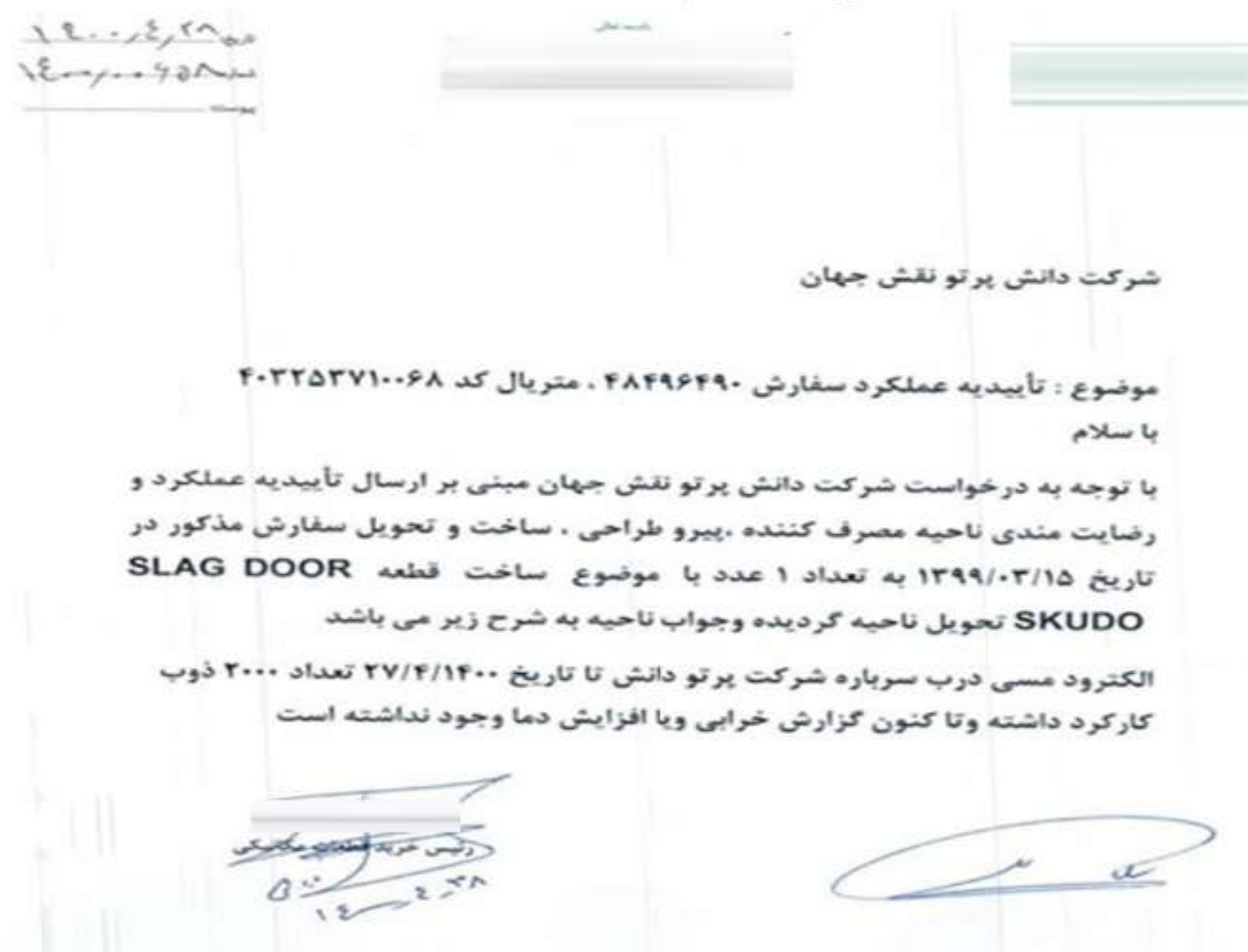
شکل ۷۱ تاییدیه عملکرد الکتروود مسی درب سرباره از