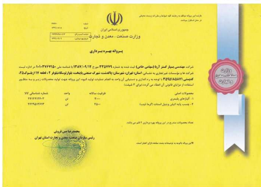
شکل ۱-۱- تصویر پروانه بهره‌برداری