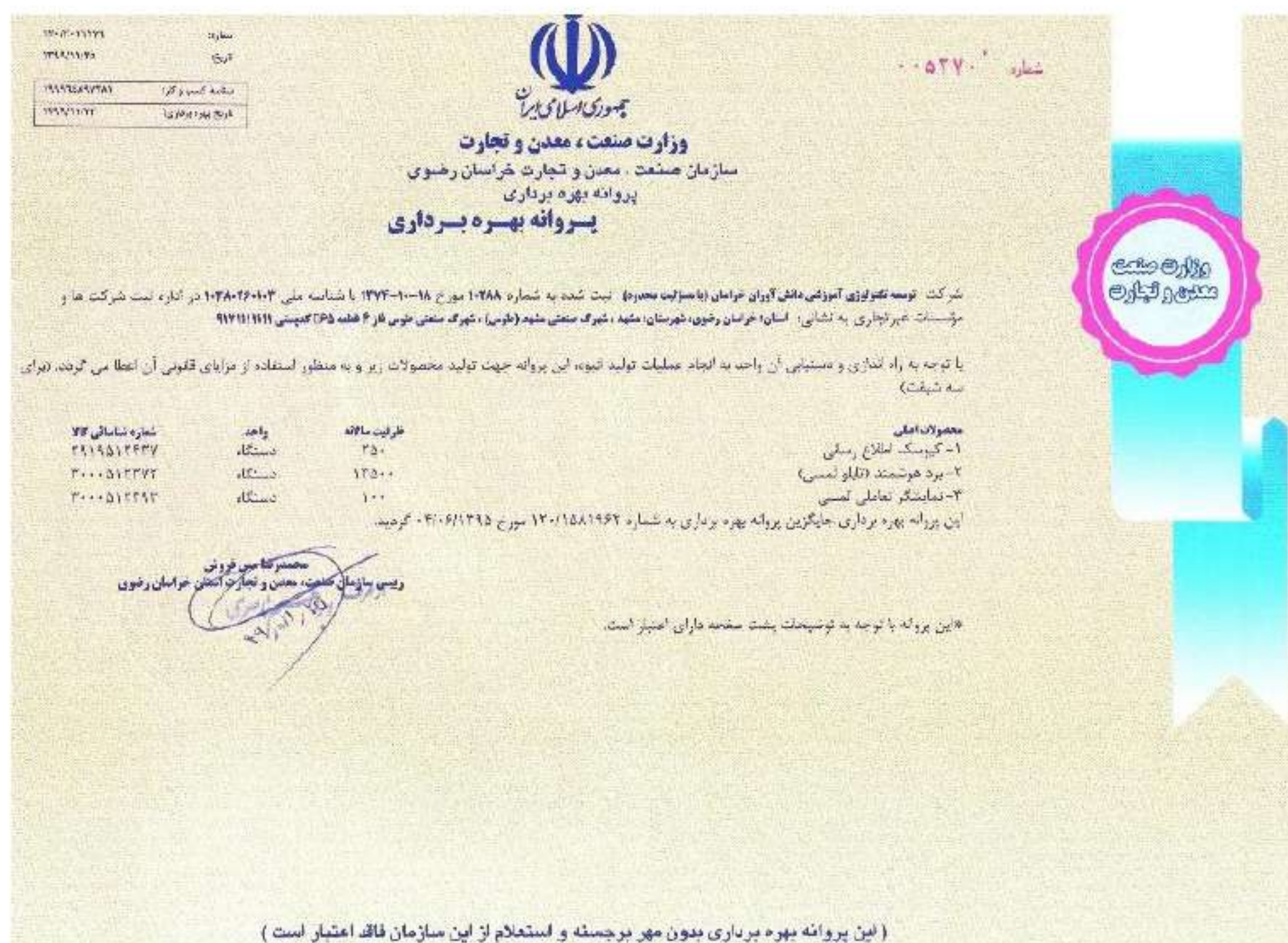
شکل ۱۱ تصویر پروانه بهره‌برداری