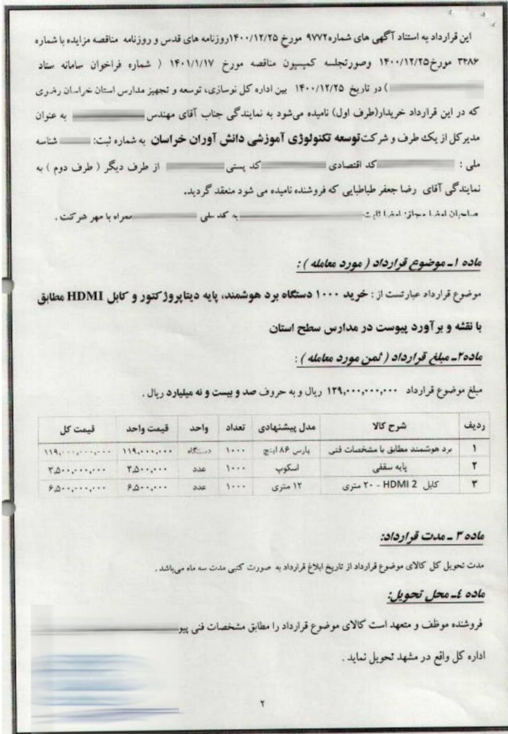
شکل ۲۰- تصویر قرارداد فروش ۱۰۰۰ دستگاه