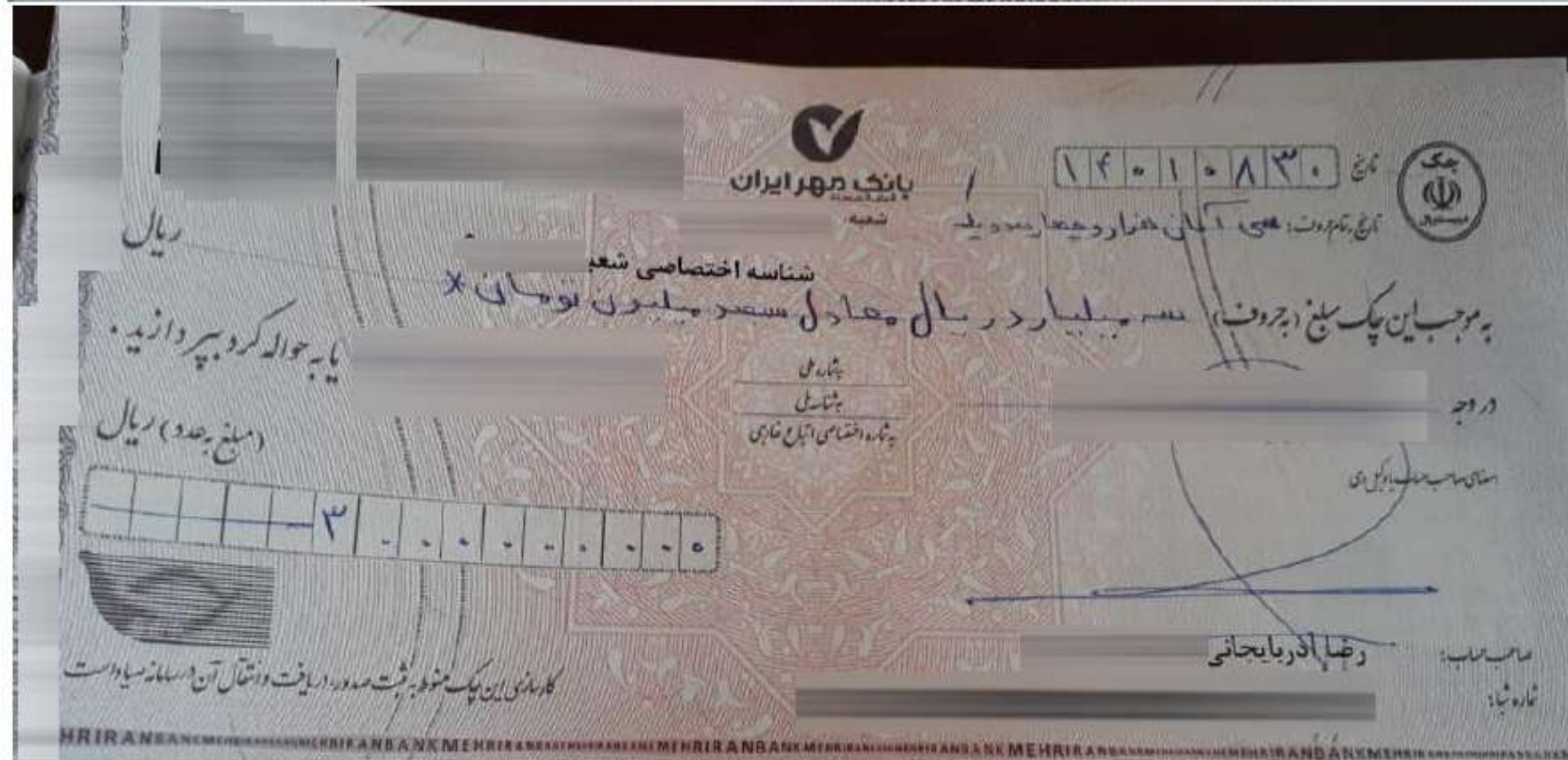
شکل ۲ تصویر چک‌های پرداختی خرید مواد اولیه پروب