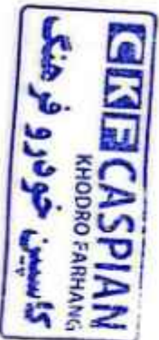
شکل ۱- تصویر فروش طرح

شرکت گاسپین خودرو فرهنگ منطقه آزاد ازنوی