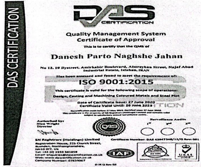
شکل ۲-۳ - تصویر مجوز ایزو ۹۰۰۱