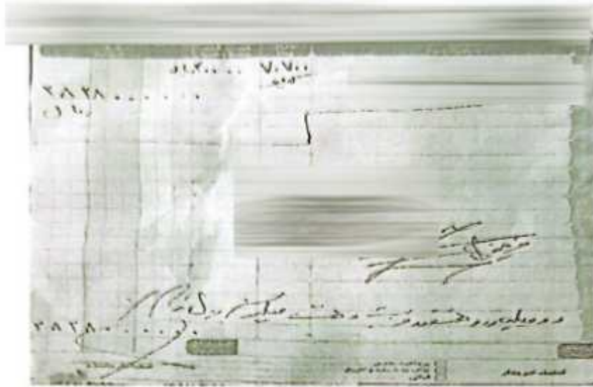
تصویر فاکتور پوست خام هسته جلو