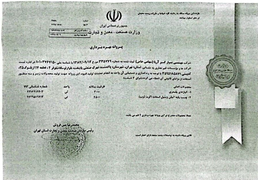
شکل ۱-۱- تصویر پروانه بهره‌برداری