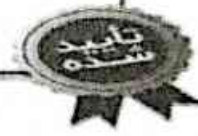
شکل ۲-۱- تصویر ارزیابی عمق ساخت توسط وزارت فناوری اطلاعات و ارتباطات برای برد هوشمند